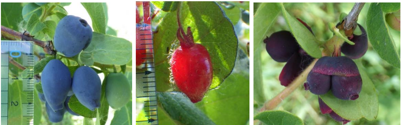
左から，ハスカップ（和名クロミノウグイスカグラ）の果実，ミヤマウグイスカグラの果実，ハスカップとミヤマウグイスカグラの種間雑種の果実。

本成果は，農学，医学，保健科学等の専門分野と分析技術を生かした北海道大学内の共同研究によるものであり，また，今後ハスカップの種間交雑を利用した新たなベリー類の開発が期待されます。なお，本研究成果は2020年10月30日（金）発刊の Plant Science 誌に掲載されました。