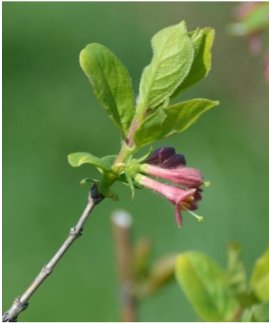
図 2.種間雑種の花。ハスカップの花に似て、二つの花の基部に一つの子房。花の色は、薄い桃色。