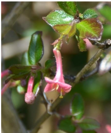
図 4.ミヤマウグイスカグラの花。一つの花の基部に一つの子房。花の色は、濃い桃色。