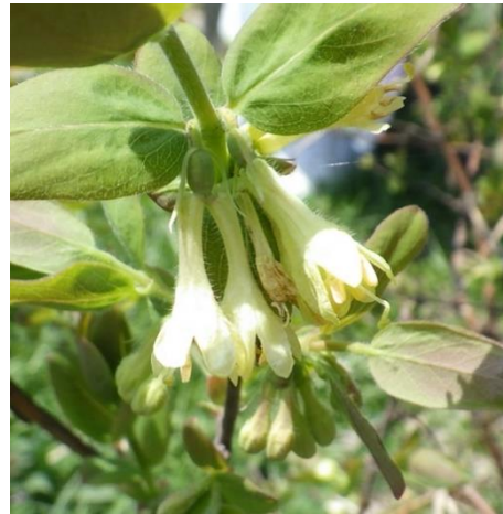
図 3.ハスカップの花。二つの花の基部に一つの子房。花の色は、クリーム色。