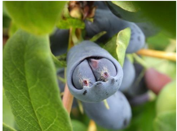
図 5.まれに見つかるハスカップの外側の皮が不完全な果実。二つの実が露出している。種間雑種の果実と類似していることがわかる。