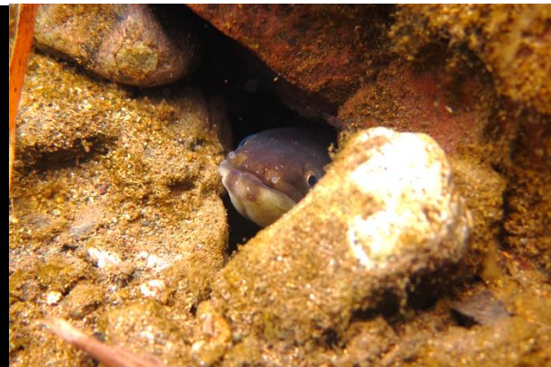
(左) シラスウナギ, (右) 河川に生息するニホンウナギ