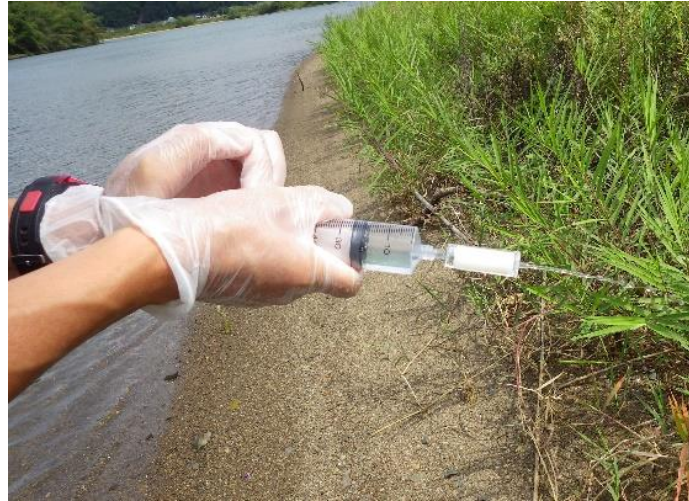
図 1. 採水した河川水をろ過している様子。注射筒の先についている白い物が、フィルターの入ったカートリッジ。