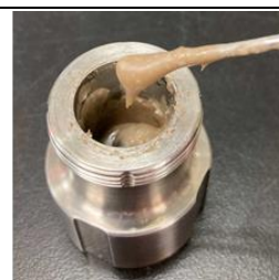
ペースト状グリニャール試薬 （このまま次の工程に使用可能）

有機溶媒を使わずに効率よく合成したグリニャール試薬。このペースト状グリニャール試薬は様々な無溶媒有機反応に使用できる。