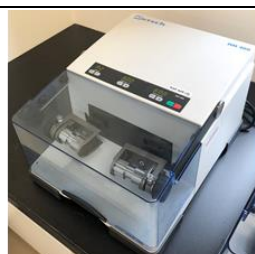
ボールミルで粉碎する