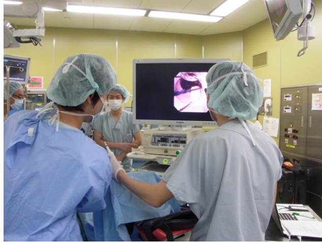
図 1. バスケット鉗子とよばれる鉗子を用いた模擬結石の抽石トレーニングの様子 場所：北海道大学病院 手術室